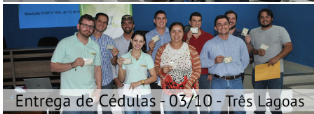
Entrega de Cédulas - 03/10 - Três Lagoas