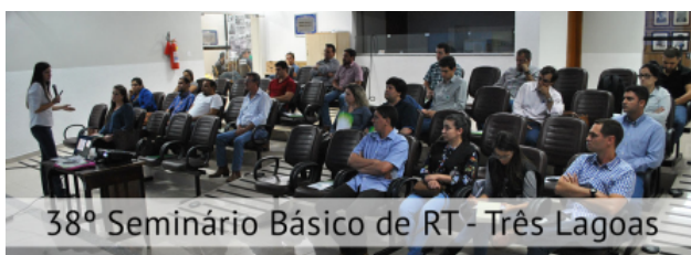
38º Seminário Básico de RT - Três Lagoas